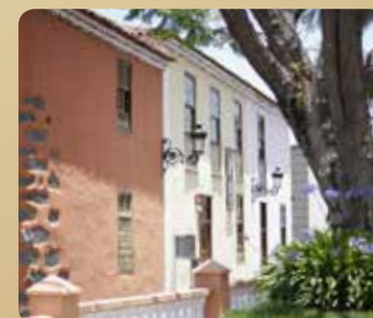
Casa de La Parra