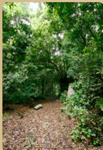
Der Pfad "camino Finca de La Pared" (in La Fajana)

Weiter auf der Strasse "calle Orilla de La Vera" bis wir zur Kreuzung mit der Landstraße "carretera de La Vera Baja" gelangen, die wieder in Richtung Schlucht führt.