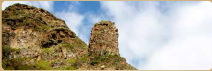
Hang der Schlucht und Fels auf dem Wanderweg "Camino de las Pencas"