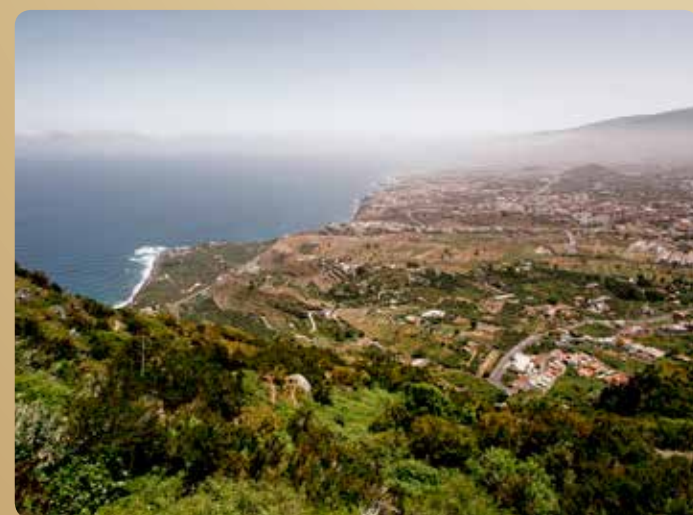
Aussichtspunkt von El Lance

Wir gehen auf dieser Straße einige hundert Meter weiter bis wir an eine Kirche kommen. Hier wird Unsere Liebe Frau der guten Reise verehrt und man gelangt in das Einkaufsgebiet von Icod el Alto.