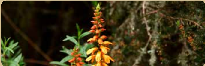
Kanarischer Fingerhut ( Isoplexis canariensis )

Außerdem befindet sich hier die Kirche von Unserer Lieben Frau zum Berge Karmel, immerwährende Ehrenbürgermeisterin von Los Realejos und Schutzheilige des Orotavats. Diese Kirche ist ein regelmäßiger Wallfahrtsort für die Marienverehrung.