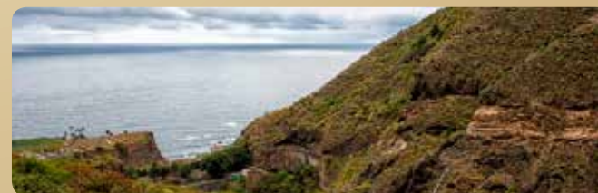
Teilsicht der Schlucht von Ruíz