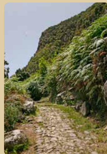
Der Weg "Camino de Las Vueltas" in Icod el Alto