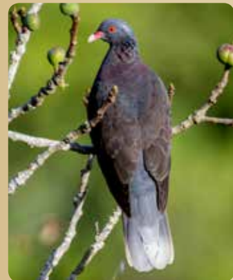
Lorbeertaube ( Columba junoniae )